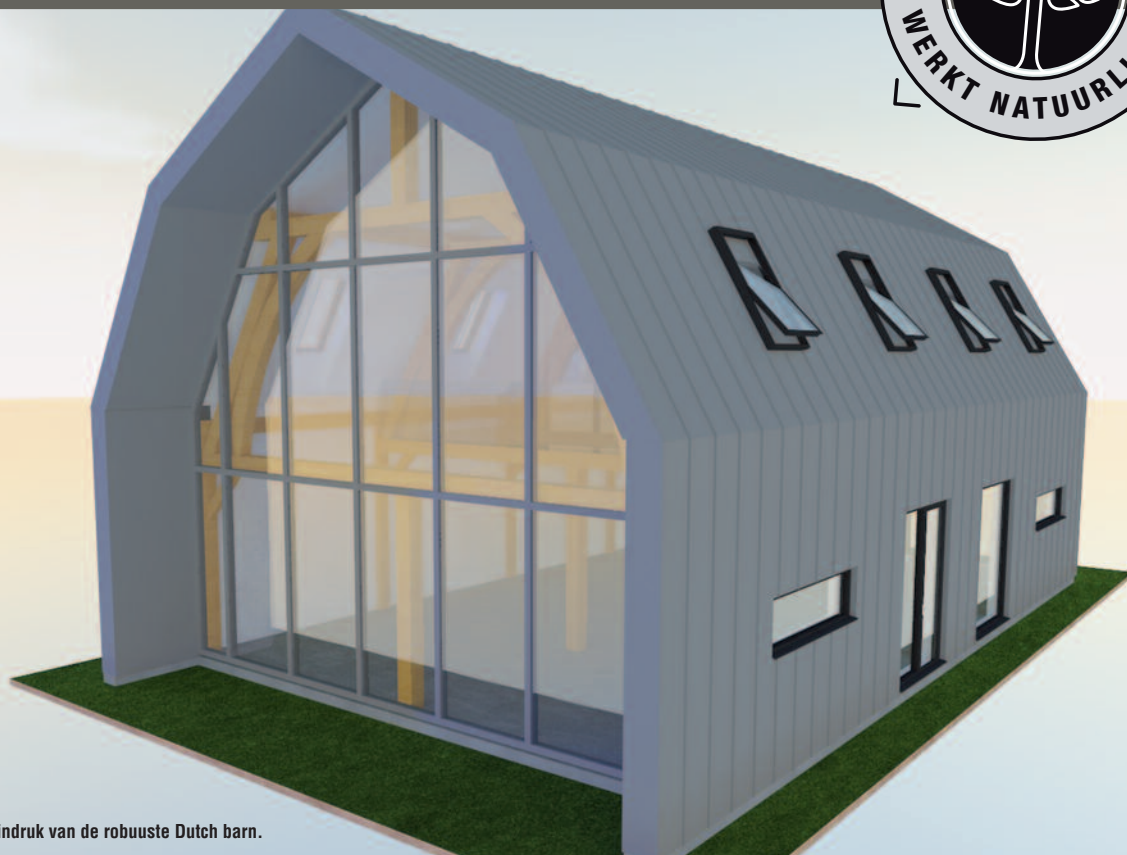
De art impressie geeft een indruk van de robuuste Dutch barn.

U wilt toch ook in een gezond klimaat werken? Een omgeving die gemaakt is van duurzame materialen. Ademend, sfeervol en inspirerend. Robuusteiken bouwt een all-inclusive bedrijfsruimte voor een nu wel heel aantrekkelijke prijs! Belt of mailt u ons gerust voor meer informatie, of kom praten tijdens een bouwbeurs.